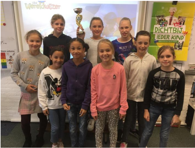
Meisjesvoetbal 4 e plaats 😊